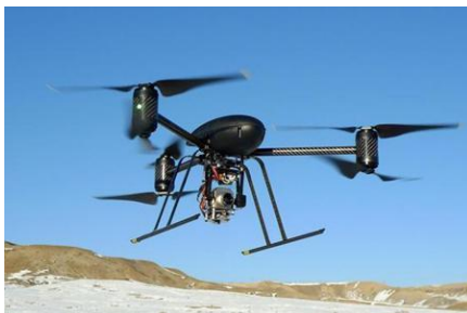
配合三轴云台直接 挂载到无人机上